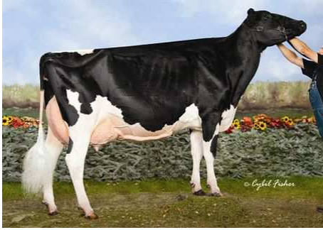
EASTSIDE LEWISDALE GOLD MISSY Dam