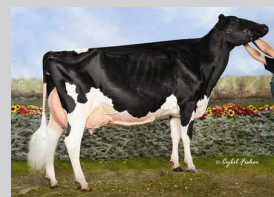
EASTSIDE LEWISDALE GOLD MISSY Dam